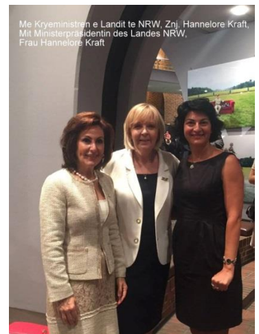
Me Kryeministren e Landit te NRW, Znj. Hannelore Kraft, Mit Ministerpräsidentin des Landes NRW, Frau Hannelore Kraft